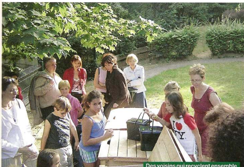
Des voisins qui recyclent ensemble leurs épluchures... Un bel exemple!